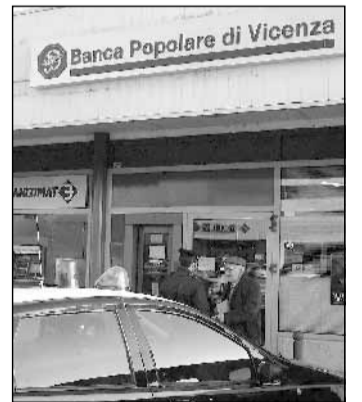
NEL MIRINO La filiale di San Michele