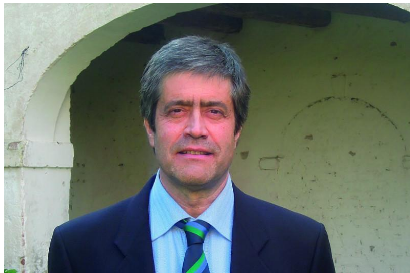
Natale Sidran, sindaco di Fossalta di Portogruaro