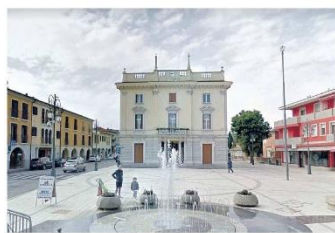
ANNONE VENETO Il municipio in piazza Vittorio Veneto