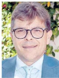
Andrea De Carlo