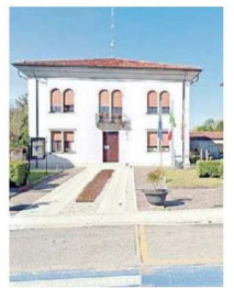
IL MUNICIPIO La sede comunale di Teglio