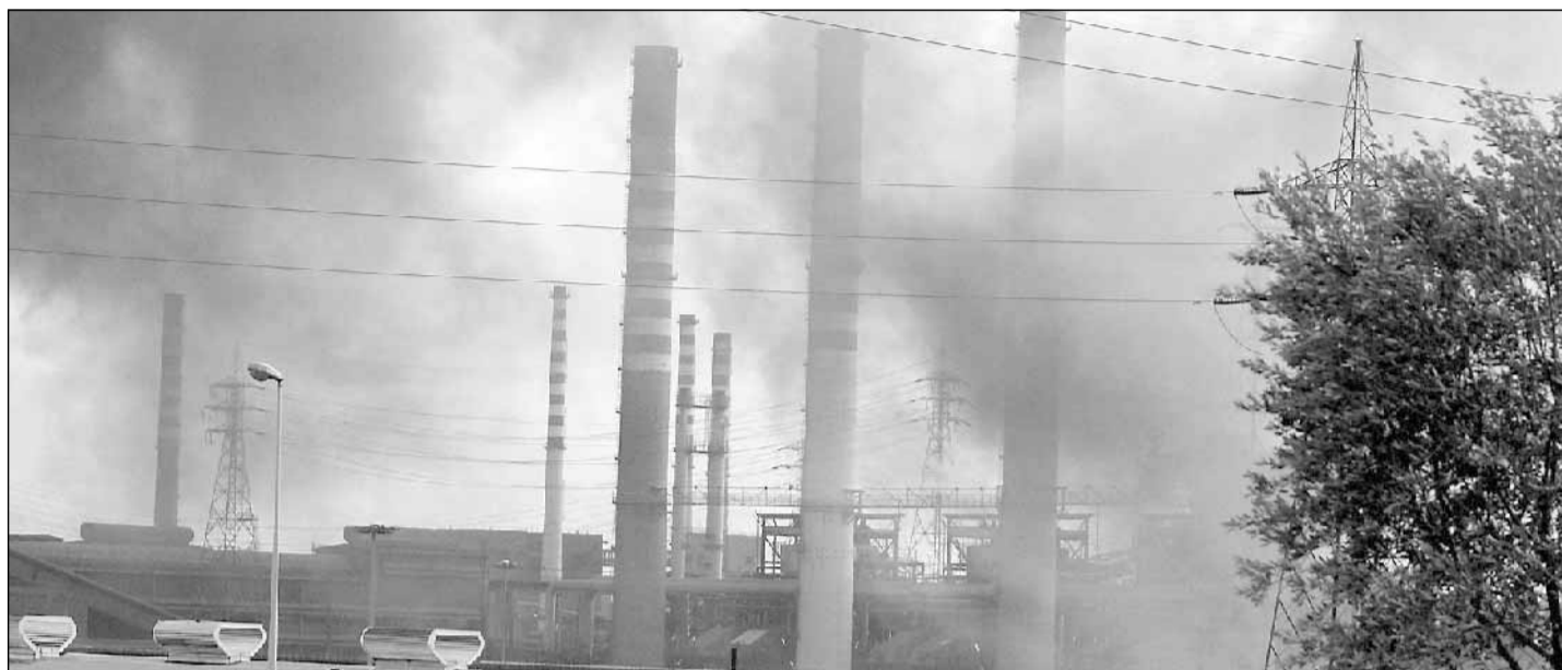
SOTTO ACCUSA Lo stabilimento siderurgico Ilva di Taranto: serviranno otto mesi per chiudere l'impianto e 336 milioni per bonificare l'area