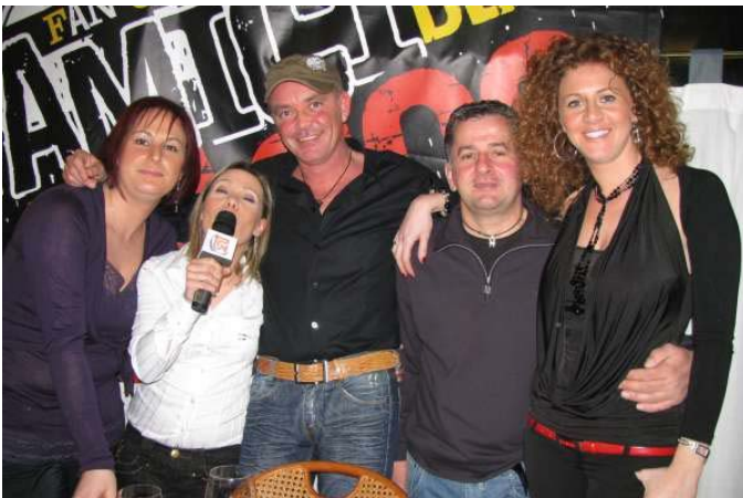
IL DIRETTIVO DEL FAN CLUB