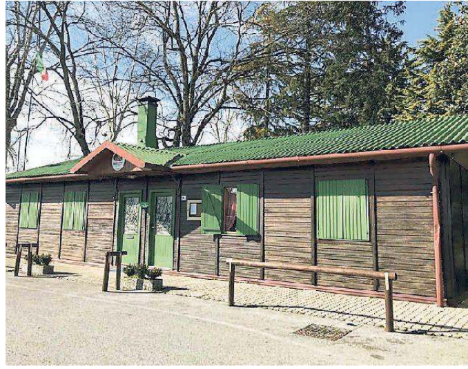
La sede degli Alpini di Portogruaro, riparo ai senzateo (Tommasella)

Il primo bisognoso è stato un senzateo con la sua valigetta colma di vestiti. Ha trovato riparo e si è scaldato al caminetto. Non si è voluto trattenere molto: dopo essersi ripreso