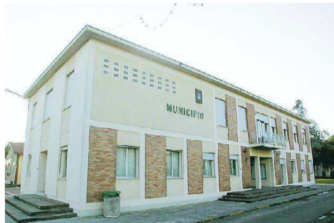
Una veduta del municipio di Pianiga