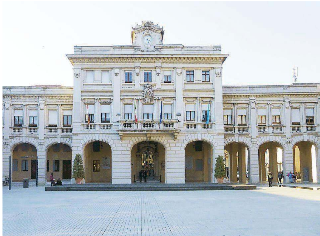
Una veduta del municipio di San Donà in piazza Indipendenza