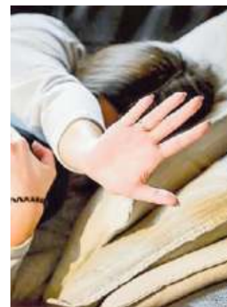
Violenza domestica, boom di casi

venzione sono centrali nel contrasto agli episodi di violenza sulle donne: «La violenza è un tema culturale, la prevenzione richiede una rete a supporto». Su base nazionale, secondo i dati diffusi dal Dipartimento Pubblica sicurezza dall'inizio dell'anno al 25 novembre scorso, le donne vittime di femminicidio sono state 88, con una media di un omicidio ogni 3,8 giorni; ogni giorno 86 donne sono vittime di reato di genere e a questa lista si deve aggiungere il numero dei tentati omicidi, delle violenze di ogni