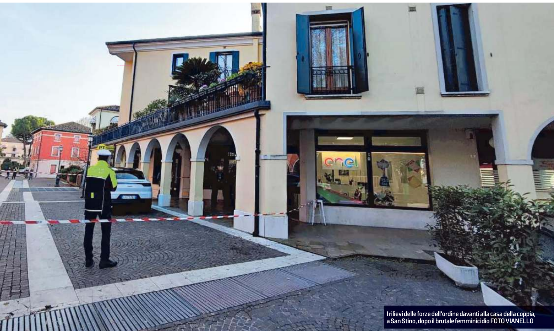
I rilievi delle forze dell'ordine davanti alla casa della coppia, a San Stino, dopo il brutale femminicidio