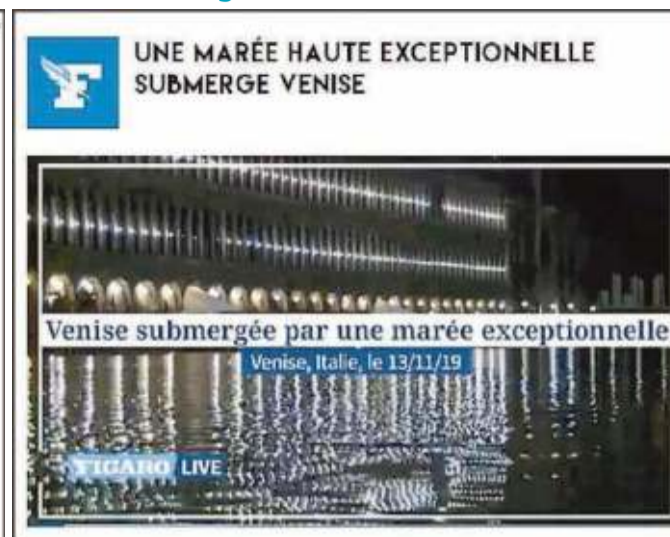
"Una alta marea eccezionale sommerge Venezia" titola il sito della prestigiosa testata francese