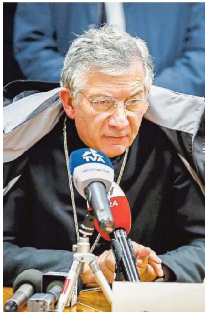
Il patriarca Francesco Moraglia

Moraglia affronta in modo insolitamente chiaro e determinato anche alcuni nodi