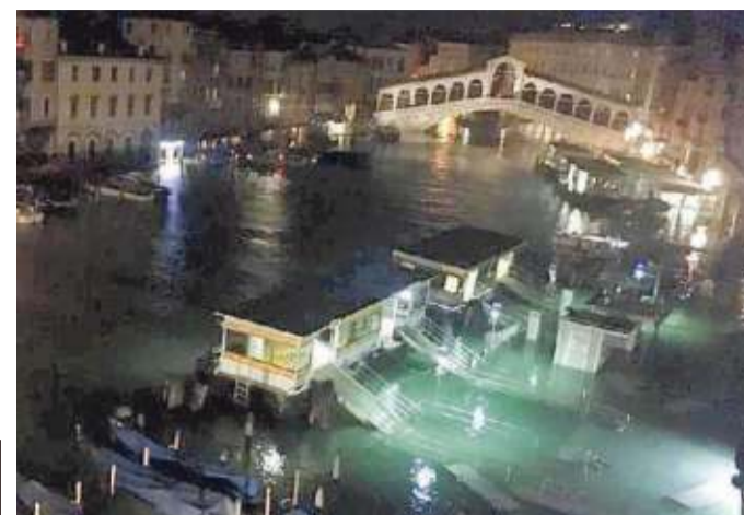
Il ponte di Rialto poco prima del black out di martedì notte

L'acqua grandissima di martedì notte, seconda nella storia della città, ma molto più colpevole della prima poiché in cinquantatré anni si poteva fare ben altro, ritrova i veneziani con le stesse armi spuntate di dieci anni, vent'anni fa. Una città senza la terra sotto i piedi, arrochita dal lamento delle sirene,