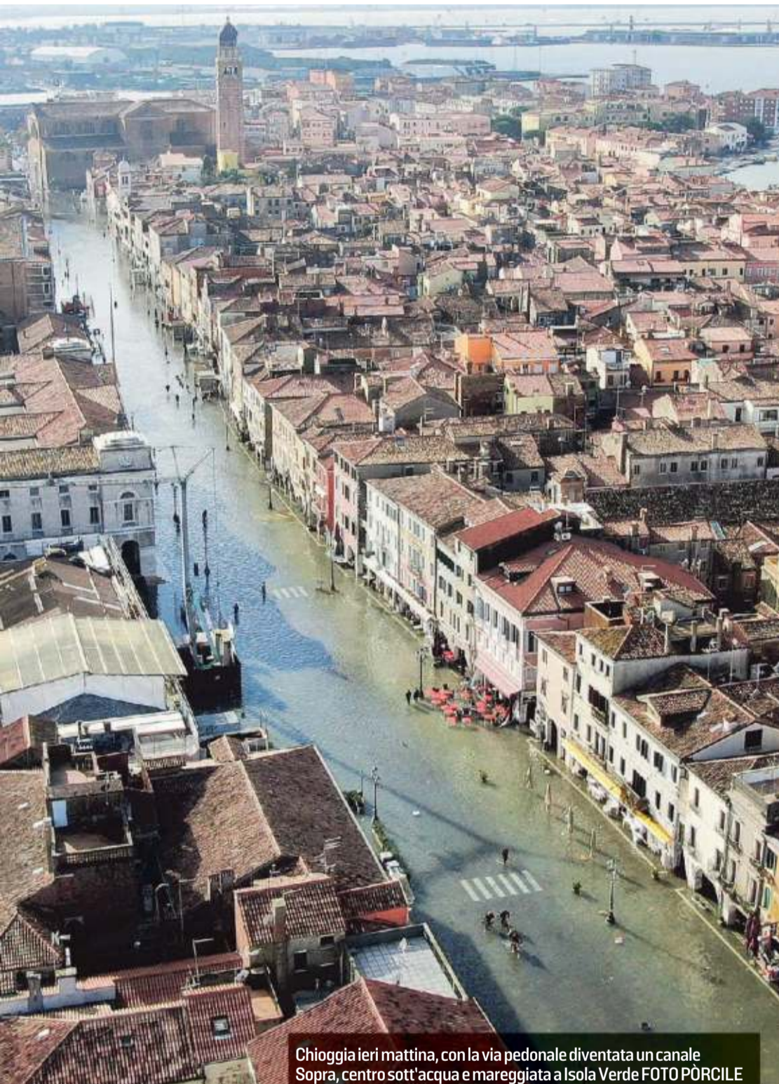
Chioggia ieri mattina, con la via pedonale diventata un canale. Sopra, centro sott'acqua e mareggiata a Isola Verde.