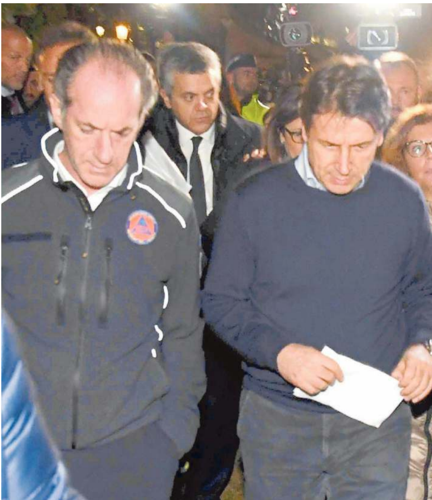
Il presidente della Regione Luca Zaia con il presidente del Consiglio Giuseppe Conte