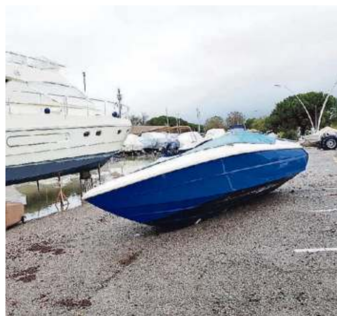
Scafo spinto in terraferma a Porto Baseleghe, Bibione