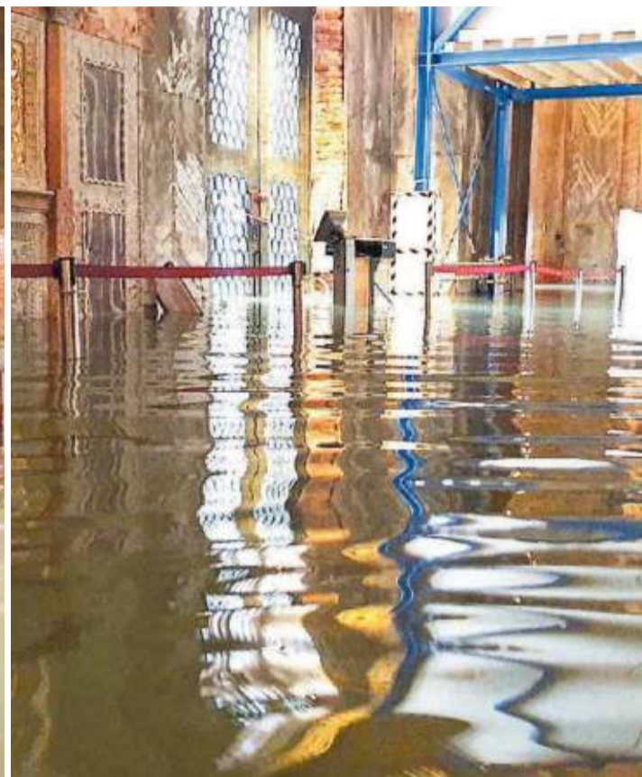
La cripta della Basilica di San Marco ieri allagata e, a destra, la zona del nartece anch'essa invasa dall'acqua

che San Marco. Dobbiamo sperare che il Mose entri finalmente in funzione quanto prima e sia realmente efficace, ma non possiamo neppure aspettare in modo indefinito il suo arrivo, i rischi per la conservazione della Basilica e del patrimonio straordinario che conserva sono troppo alti. Per questo stiamo elaborando un nostro progetto di messa in sicurezza idraulica anche dalle acque alte eccezionali della Basilica, valutando diverse possibilità e anche su questo chiediamo il contributo del ministero dei Beni culturali».