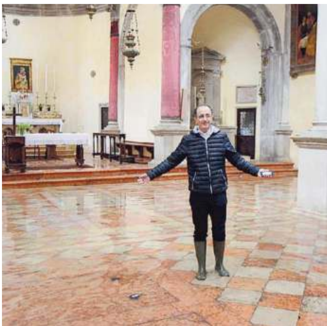
La chiesa di San Cassiano nelle stesse condizioni