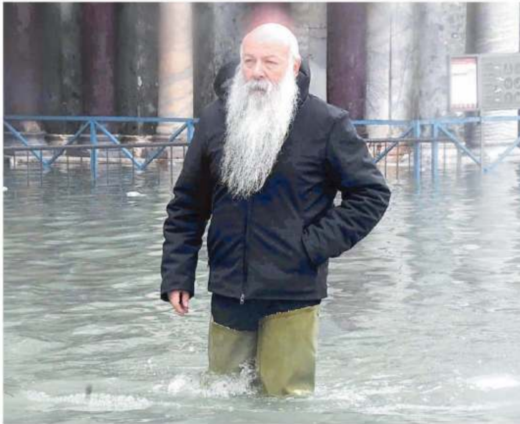
Gli stivali a tutta gamba per attraversare Piazza San Marco e lo sguardo mesto: come Venezia

lare ritorna. Eccezionale. Non sono d'accordo. Ciò che è accaduto nel '66 lo era. Per quella generazione fu un evento eccezionale, inedito, spaventoso. Noi non possiamo, non dobbiamo leggere l'eccezionalità nell'acqua che invade Venezia e sommerge i marmi marcianti. Saremmo ipocriti se lo facessimo, saremmo ingiusti con noi stessi, con Venezia e i veneziani. Perché se è vero che in tutto sono sei le volte in cui San Marco è stata invasa dalle acque, e questo legittimerebbe all'apparenza l'eccezionalità, tre di queste sei volte ricadono negli ultimi