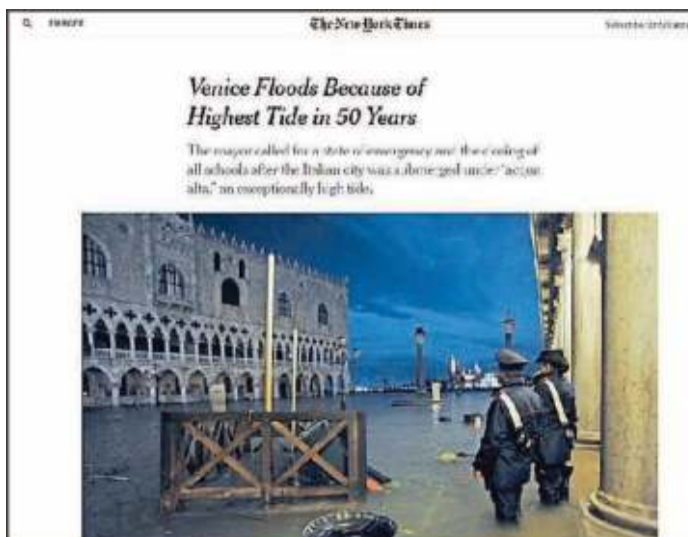
"Venezia affonda a causa della marea più alta da cinquant'anni", scrive il New York Times