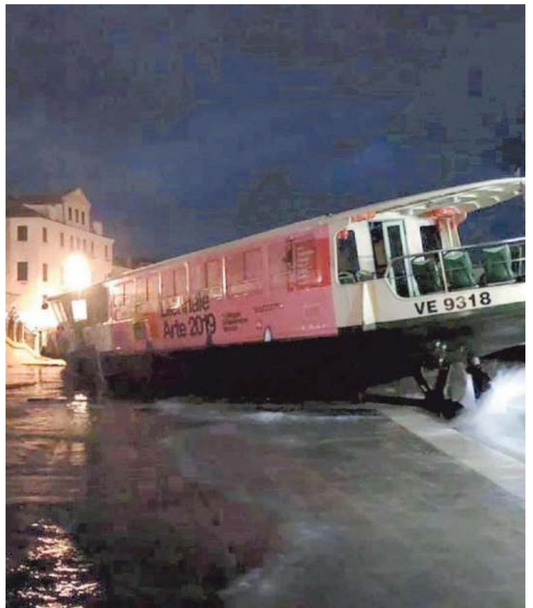
Un vaporetto scaraventato su Riva degli Schiavoni