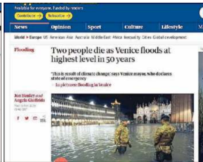
"Due persone muoiono mentre Venezia è sommersa dai livelli più alti in 50 anni"

L'attore Stefano Accorsi è in città fino a metà dicembre per girare un film da protagonista. Intervistato da Radio DeeJay racconta: «Acqua nel ristorante dove mangiavamo»