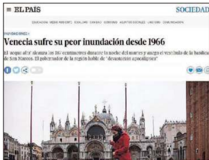
"Venezia soffre per la peggior inondazione dal 1966" scrive il giornale spagnolo più diffuso