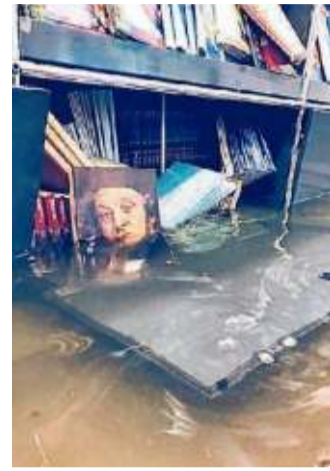
La Querini sott'acqua

«Ricordiamo che l'emergenza che sta colpendo Venezia potrebbe non essere conclusa e che quanto annunciato potrebbe subire delle variazioni», aggiunge prudentemente in una nota la stessa Fondazione Musei Civici. Chiusa ieri anche la Biennale Arti Visive ai