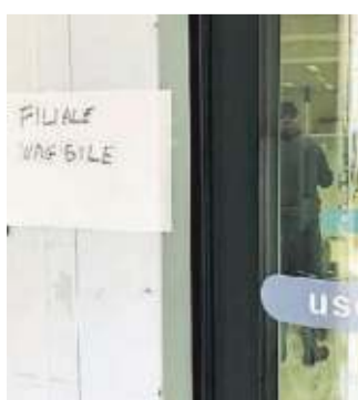
Filiale della banca inagibile