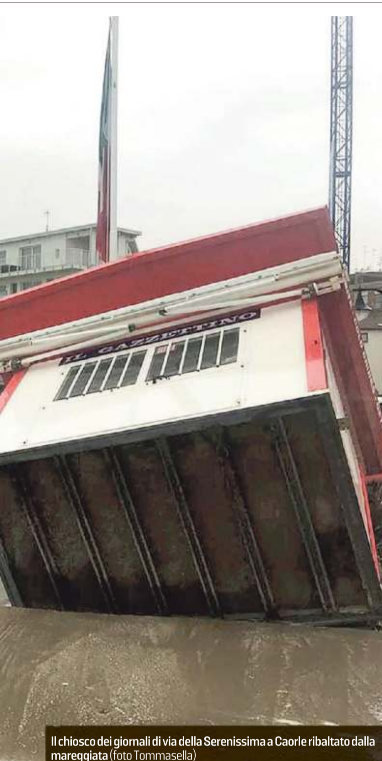
Il chiosco dei giornali di via della Serenissima a Caorle ribaltato dalla mareggiata