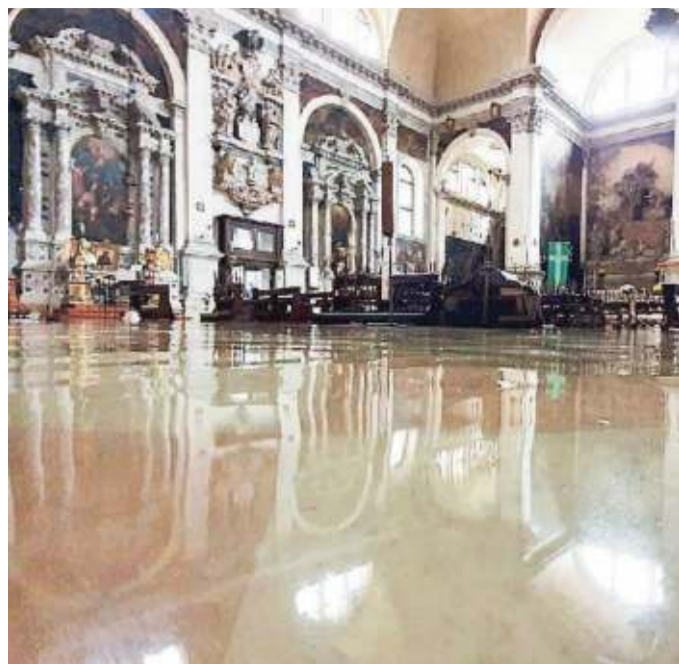
La chiesa di San Moisè allagata