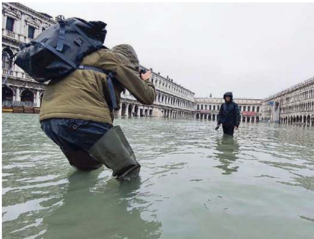
Sopra, l'edicola delle Zattere e sotto turisti si fanno le foto in Piazza San Marco

sanno che futuro li aspetti. Impossibile cancellare l'immagine in Riva degli Schiavoni delle gondole accatastate le une sulle altre nel buio di una notte illuminata da una luna piena lontana dall'angoscia degli umani. Impossibile dimenticare il fragore dell'acqua a Castello dove la marea ha trasformato via Garibaldi nel letto di un fiume in piena. Impossibile non sentire una fitta al cuore alla vista delle balaustre spezzate, del muro dell'isola di San Servolo distrutto e delle attività sommerse da un evento più grande di tutta la città. Oltre a questo lo sfregio di un turismo che continua a considerare Venezia una Disneyland in cui le persone sono solo comparse che possono essere fotografa-