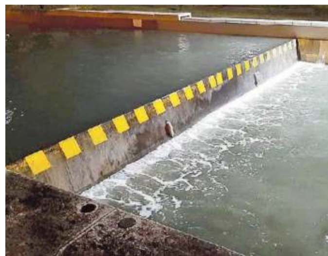
Le paratoie mobili di Malamocco non hanno retto la marea di martedì

Le Vignole sono letteralmente finite sott'acqua. Il momento peggiore è avvenuto intorno alle 23, quando nell'isola l'acqua ha superato abbondantemente il metro sopra il li-