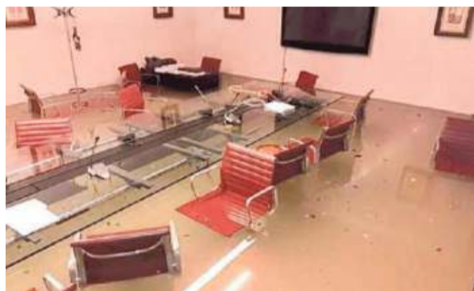
Una stanza allagata di palazzo Ferro-Fini