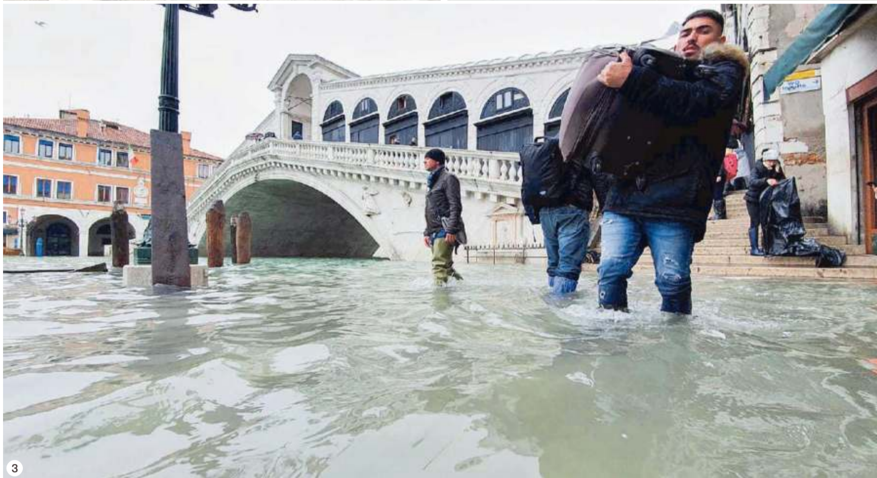
Alcune immagini di ordinaria devastazione: nella foto 1 un muretto crollato a Villa Heriot mentre nella foto 2 si vede una gondola appoggiata su due panchine in calle delle Rasse. Accanto al ponte di Rialto invece (foto 3) un turista tiene un trolley per evitare che finisca in acqua: il disagio è evidente, in una giornata infernale per Venezia