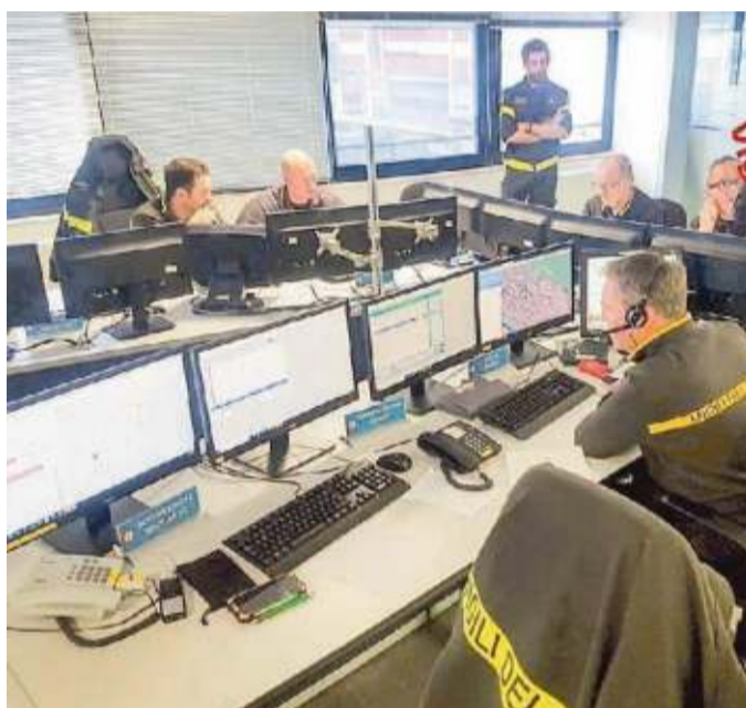
La operativa del comando dei vigili del fuoco

Stavolta potrebbe andare così. E a Venezia i danni sono molto più grandi. Interi se-