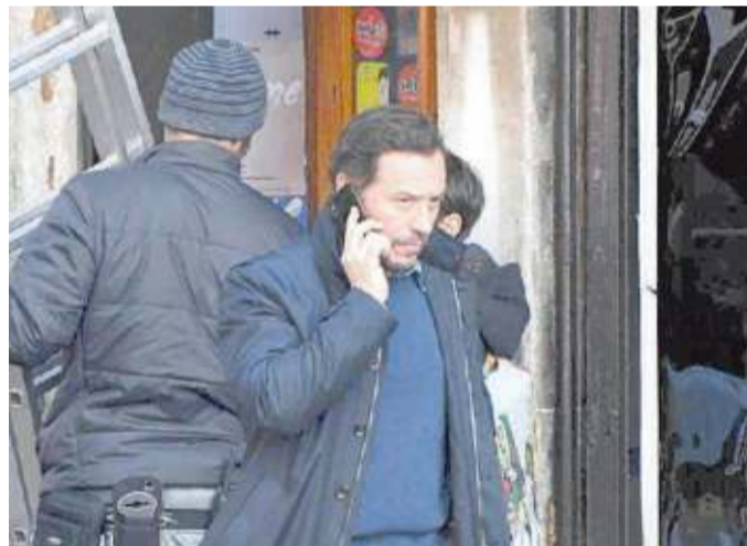
Stefano Accorsi sul set del film che sta girando a Venezia

« M ando un grande abbraccio a tutti i veneziani, perché mi sono reso veramente conto di quanto questa situazione possa essere non solo disagiata, ma impressionante e pericolosa». Sono le parole con cui Stefano Accorsi, in questi giorni a Venezia per le riprese di un film che lo vedrà come protagonista, ha concluso un'intervista rilasciata ieri mattina a Linus e Nicola Savino, sulle frequenze di Radio DeeJay, nel corso della trasmissione "Deejay chiama Italia". «Sono a Venezia a girare un film, mi fermerò fino a metà dicembre», ha spiegato l'attore, in diretta dal set, prima di raccontare quanto vissuto in prima persona la sera precedente. «Un fenomeno pazzesco, eccezionale e disastroso» che ha danneggiato la stessa produzione. «I magazzini in cui era contenuto il materiale del film si sono allagati. Ma, con un programma ridotto, siamo riusciti a girare anche