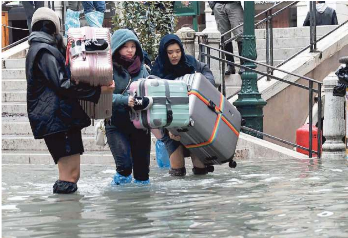
Turisti orientali in difficoltà a San Moisè: l'acqua grande è talmente alta che non si riesce più a muoversi per il centro storico

Onde altissime in Adriatico. Quasi sei metri registrati alla Piattaforma del Cnr, otto chilometri al largo del Lido. Ma un metro alla Misericordia,