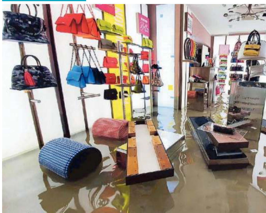
A sinistra, borse e scaffali che galleggiano all'interno di un negozio alle Mercerie. A destra, vasi rovesciati dalla corrente davanti all'ingresso dell'Hotel Gritti