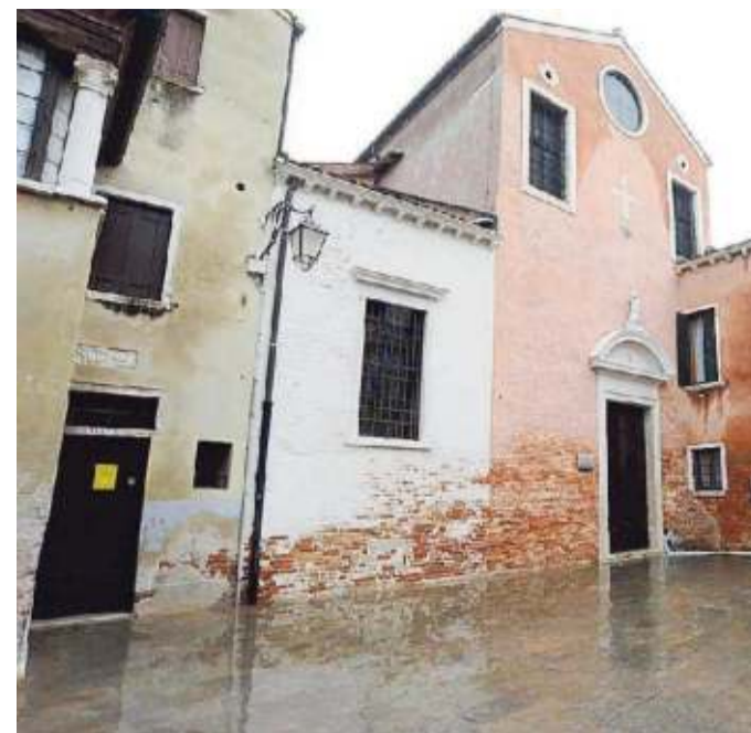
L'esterno della chiesa di San Giacomo dell'Orio anch'essa sott'acqua