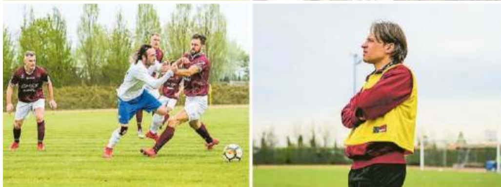
Momenti emozionanti per una pagina di storia del calcio a Portogruaro. La foto ricordo della squadra dopo il successo, le immagini del gol partita, dei giocatori, della sfida con il Montello e del tecnico De Cecco