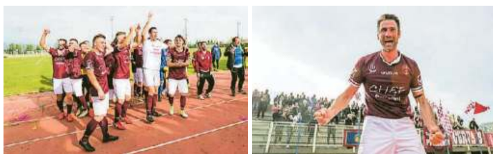
Lo stadio di Volpago del Montello granata come il Mecchia nel giorno del trionfo. Tra tifosi e giocatori per tutta la stagione il feeling è sempre stato molto intenso