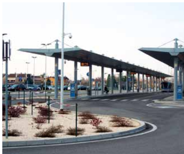
Area stazione ferroviaria - SFMR