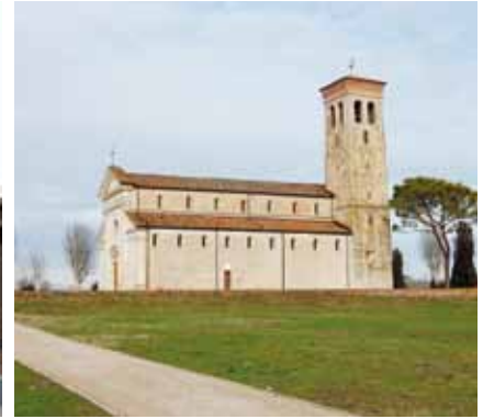
Percorsi corte abbaziale - Summaga