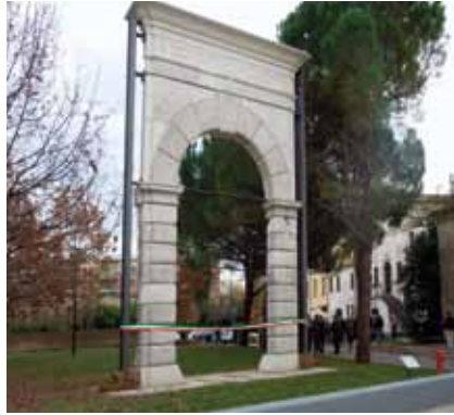
Arco del Fondaco