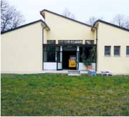
Centro Anziani Lugugnana