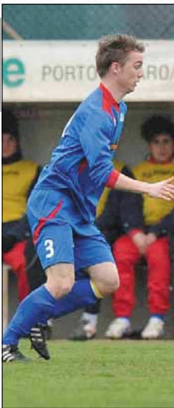
IN GOL Della Valentina, Portogruaro

NOTE - Angoli: 6-1 per la Fossaltese. Ammoniti: Sartori, Lermee, Guerra. Recupero: st 4'. Al 32' pt curiosa entrata in campo di un cane dalla veloce falcata poi recuperato dal padrone.