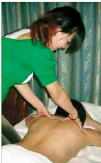
INDAGINE Massaggi con sesso

rio di lavoro: quello regolare alla luce del sole e quello illecito nascosto dietro aiativi di un'attività al pianterreno di via Mantegna, nel cuore