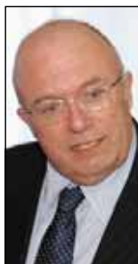
DIMISSIONI IRREVOCABILI La governatrice del Lazio, Renata Polverini: «Vado via pulita». Francesco Storace: «Ha sofferto più di tutti»