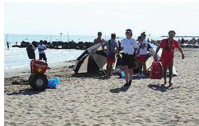
I concitati momenti dei soccorsi ieri pomeriggio a Caorle