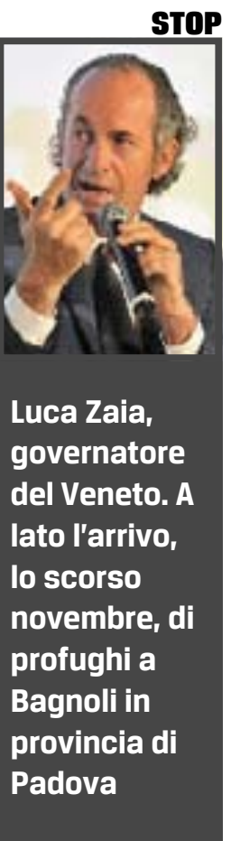
Luca Zaia, governatore del Veneto. A lato l'arrivo, lo scorso novembre, di profughi a Bagnoli in provincia di Padova

L'assessore Lanzarin: ho avvisato il prefetto