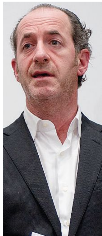
Il governatore Luca Zaia